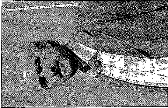
Rådmann hevder å holde sin fane høyt når det gjelder å behandle alle likt i byggesaker.